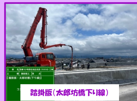
踏掛版(太郎坊橋下り線)