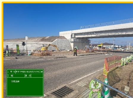
現場調査 基準点測量