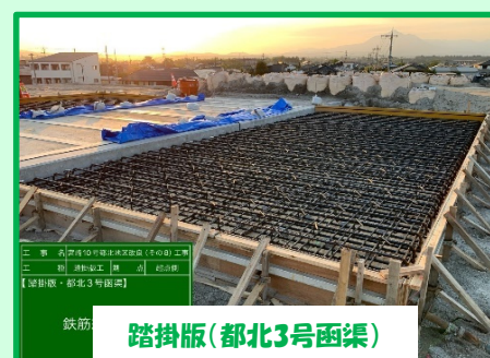
踏掛版(都北3号函渠)