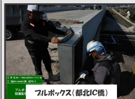
フィルボックス(都北C橋)