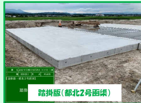
踏掛版(都北2号函渠)