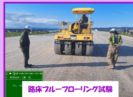
路床フルフローリング試験